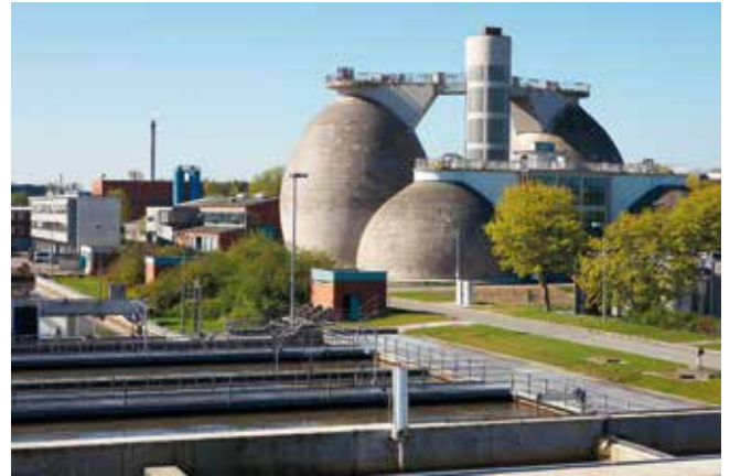
In den großen Faultürmen wird aus dem Klärschlamm Biogas gewonnen. 20 Mio. m 3 Abwasser werden jährlich im ZKW gereinigt.

Das Zentralklärwerk Lübeck (ZKW) wurde am 30.6.1967 nach rund sechs Jahren Bauzeit in Betrieb genommen. Die erste Ausbaustufe umfasste damals eine mechanische und biologische Aufbereitung des Abwassers. Zu Beginn war lediglich der Lübecker Stadtteil St. Lorenz Nord angeschlossen. 50 Jahre und mehrere Ausbaustufen später hat sich das Zentralklärwerk zu einem der größten und modernsten Klärwerke Schleswig-Holsteins entwickelt.