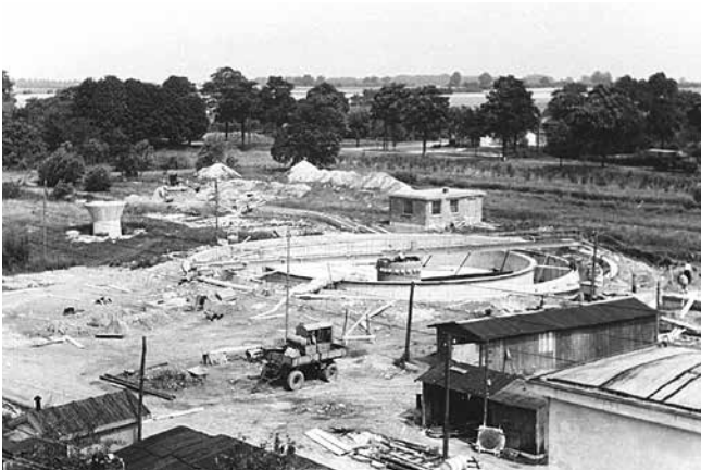
Das Zentralklärwerk kurz nach Baubeginn im Jahre 1961. Bei der Inbetriebnahme war zunächst nur St. Lorenz Nord angeschlossen.