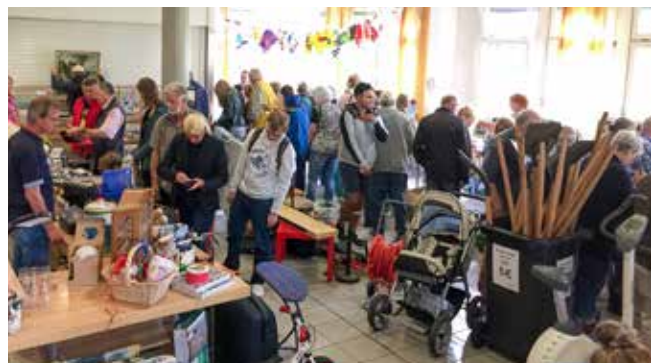
■ Die Kantine der Entsorgungsbetriebe Lübeck wurde zum Flohmarkt umfunktioniert. Diesmal war die Kapazitätsgrenze allerdings erreicht.

reich und regelmäßig realisieren. Der nächste ist für den Spätherbst geplant.