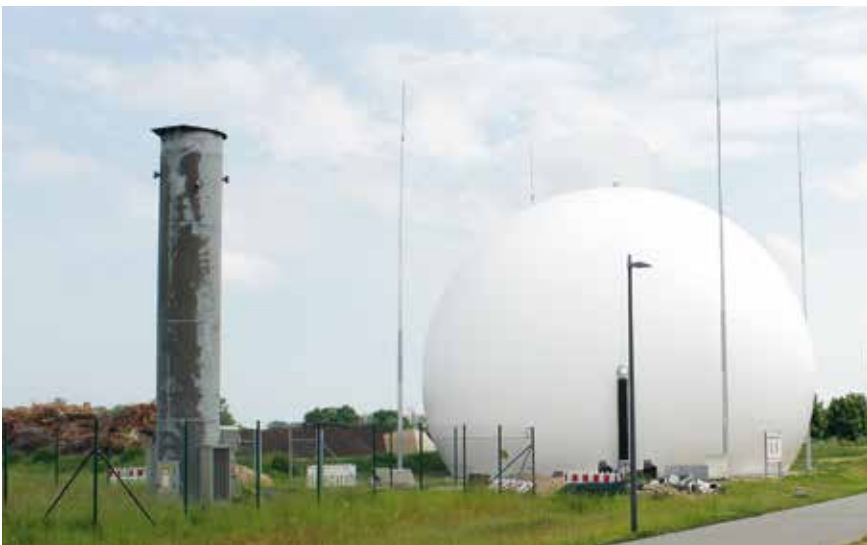
Der neue, größere Gasspeicher der MBA kann 5.300 m 3 Biogas zwischenspeichern.

In der Mechanisch biologischen Abfallbehandlungsanlage (MBA) wurden in 2016 rund 99.000 Tonnen Abfälle weiterverarbeitet. Die Hälfte davon sind Biobafälle aus Lübeck, Kiel, Steinburg, Bad Segeberg und Neumünster. Die Biogasproduktion ist durch die zusätzlichen Bioabfälle aus dem Umland und die technischen Optimierungen der Anlage in den letzten Jahren um 250 Prozent gestiegen.