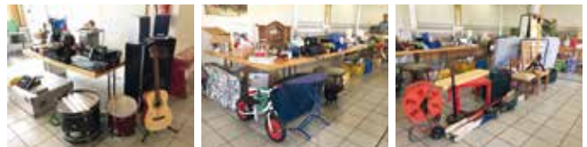
■ Musikinstrumente, Fahrräder, Werkzeuge, Spielsachen, Geschirr. Der EBL Flohmarkt bietet für jeden Schnäppchenjäger etwas.

Herzlichen Dank allen Spendern, Käufern und Helfern. Ohne Sie könnten wir den Flohmarkt nicht so erfolg-