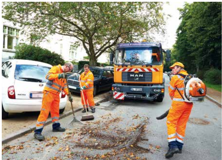
▣ Teile der aktuellen Straßenreinigungsgebührensatzung sind vom Schleswig-Holsteinischen Oberverwaltungsgericht für unwirksam erklärt worden.

Inwieweit das Urteil Einfluss auf die Höhe einer in Teilen neu zu kalkulierenden Straßenreinigungs- bzw. Winterdienstgebühr haben wird, lässt sich jetzt noch nicht absehen. Das Gericht hat bisher nur eine knappe Pressemitteilung veröffentlicht. Eine ausführliche Urteilsbegründung liegt zum jetzigen